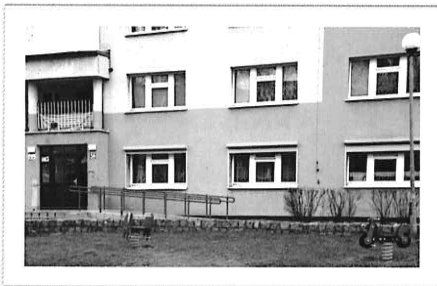
Placówka Opiekuńczo - Wychowawcza nr 1

Pokoje mieszkalne wyposażone są w meble i sprzęt zgodny z obowiązującymi standardami. W pobliżu mieszkania znajduje się ogólnodostępny plac zabaw oraz boisko sportowe.