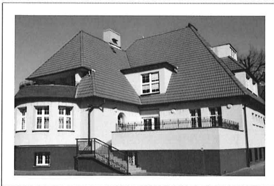
Placówka Opiekuńczo - Wychowawcza nr 6