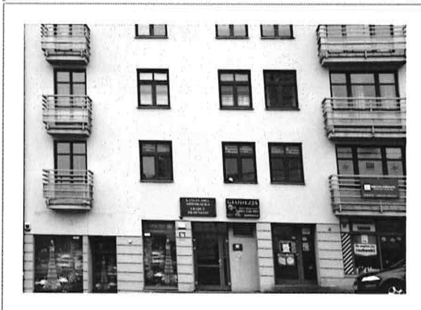
Placówka Opiekuńczo - Wychowawcza nr 3