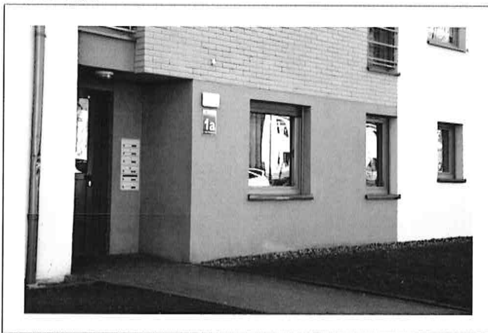
Placówka Opiekuńczo - Wychowawcza nr 5

W pobliżu mieszkania znajduje się ogólnodostępny plac zabaw z miejscem do wypoczynku i rekreacji.