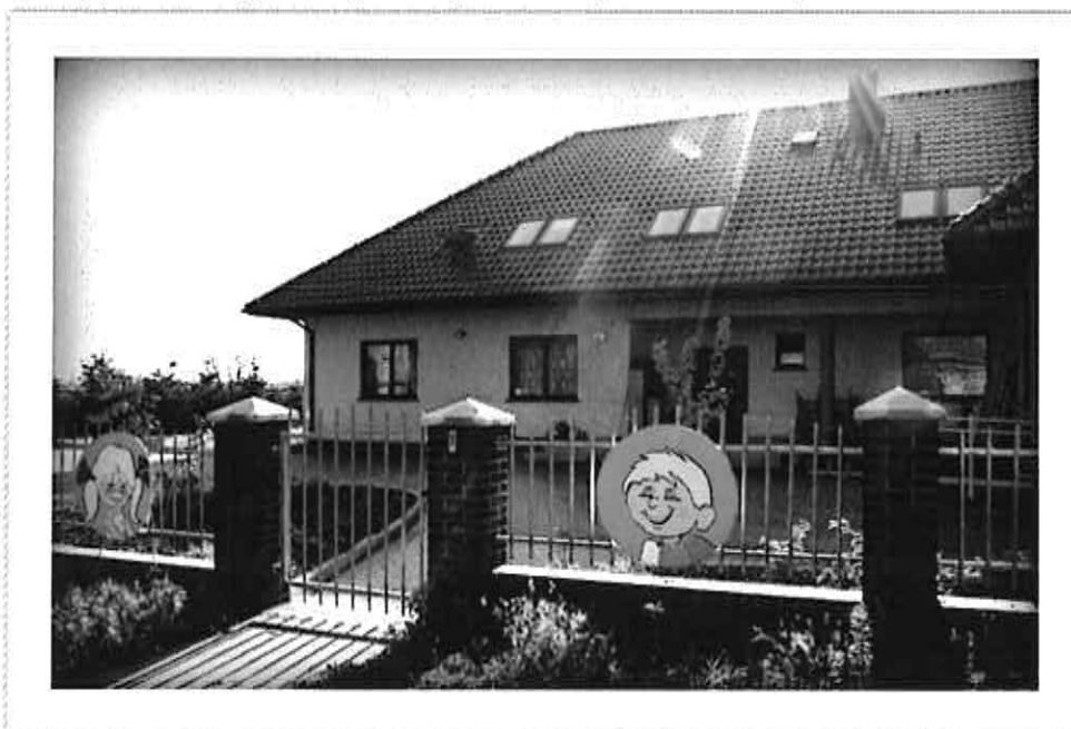
Placówka Opiekuńczo - Wychowawcza nr 4

Przy nieruchomości znajduje się teren zielony wraz z placem zabaw, który jest miejscem wypoczynku i zajęć rekreacyjno – sportowych dla wychowanków placówki.