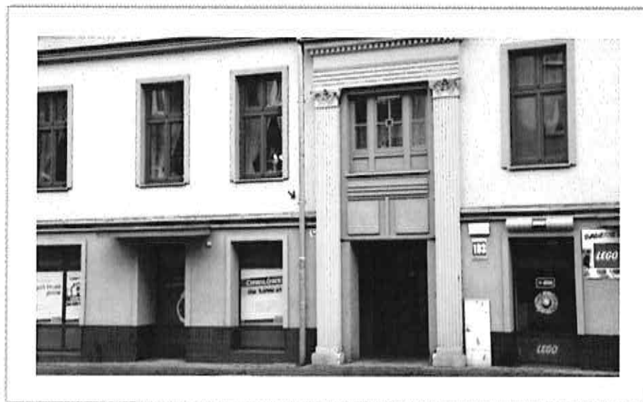
Placówka Opiekuńczo - Wychowawcza nr 2

Mieszkanie posiada: 6 pokoi mieszkalnych, 2 łazienki, pokój do nauki, aneks kuchenny, pomieszczenie stanowiące wspólną przestrzeń mieszkalną. Pokoje mieszkalne wyposażone są w meble i sprzęt zgodny z obowiązującymi standardami. W pobliżu znajduje się ogólnodostępny plac zabaw.