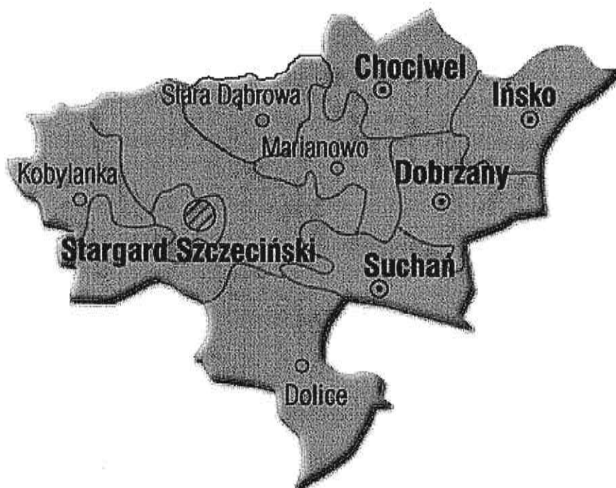
Rys. 1. Położenie Gminy Stara Dąbrowa na terenie powiatu stargardzkiego

Sieć osadnicza gminy obejmuje 18 jednostek osadniczych: Stara Dąbrowa, Nowa Dąbrowa, Krzywnica, Kicko, Storkówko, Załęczce, Łęczycza, Parlino, Białuń, Łęczyna, Tolcz, Chlebówko, Chlebowo, Rosowo, Moskorze, Rokicie, Wiry, Łęczówka skupionych w 13 miejscowościach sołectkich: Stara Dąbrowa, Nowa Dąbrowa, Krzywnica, Kicko, Storkówko, Załęczce, Łęczycza, Parlino, Białuń, Łęczyna, Tolcz, Chlebówko i Chlebowo. Zdecydowana większość jednostek osadniczych posiada zwarty charakter zabudowy