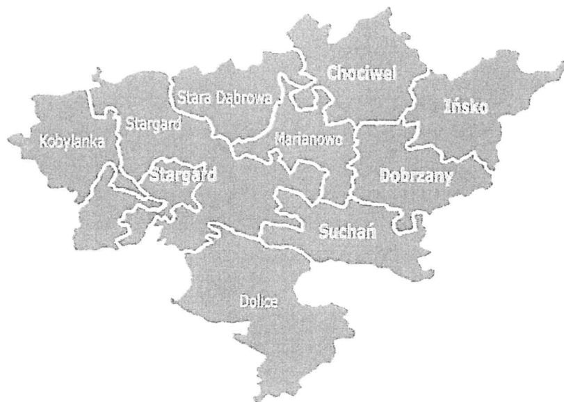
rys. Powiat Stargardzki

Dokument ten jest wynikiem doświadczeń z dotychczasowej wieloletniej współpracy z organizacjami pozarządowymi z lat poprzednich. Powstał on w oparciu o wiedzę, praktykę, doświadczenie i zaangażowanie jego realizatorów.