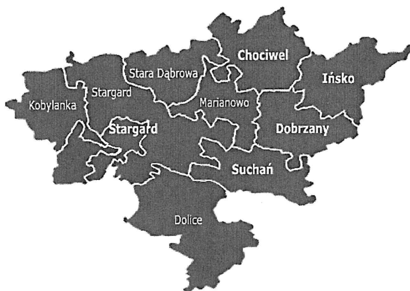
rys. Powiat Stargardzki

Dokument ten jest wynikiem doświadczeń ze współpracy z organizacjami pozarządowymi z lat poprzednich. Powstał on w oparciu o wiedzę, praktykę, doświadczenie i zaangażowanie jego realizatorów.