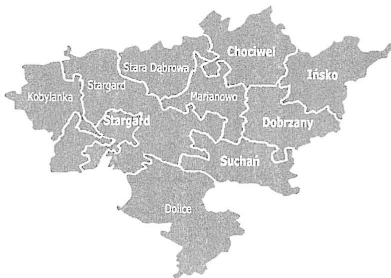
rys. Powiat Stargardzki

Dokument ten jest wynikiem doświadczeń z dotychczasowej wieloletniej współpracy z organizacjami pozarządowymi z lat poprzednich. Powstał on w oparciu o wiedzę, praktykę, doświadczenie i zaangażowanie jego realizatorów.