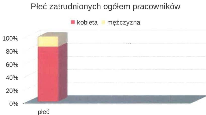
Wykres nr 1. Płeć zatrudnionych ogółem pracowników

Wśród pracowników dominują kobiety, wykres nr 1 przedstawia strukturę płci zatrudnionych ogółem pracowników.