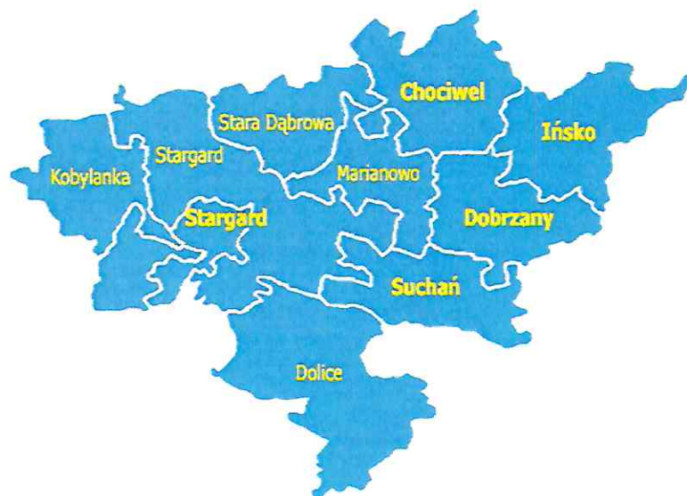
rys. Powiat Stargardzki

Dokument ten jest wynikiem doświadczeń z dotychczasowej wieloletniej współpracy z organizacjami pozarządowymi z lat poprzednich. Powstał on w oparciu o wiedzę, praktykę, doświadczenie i zaangażowanie jego realizatorów.