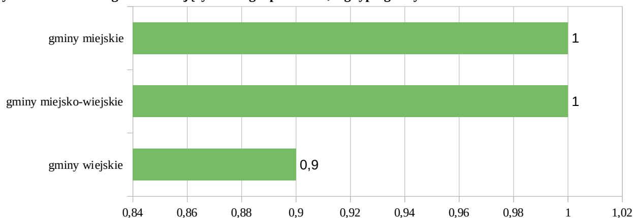
Rysunek 3: Odsetek gmin realizujących usługi opiekuńcze, wg typu gminy