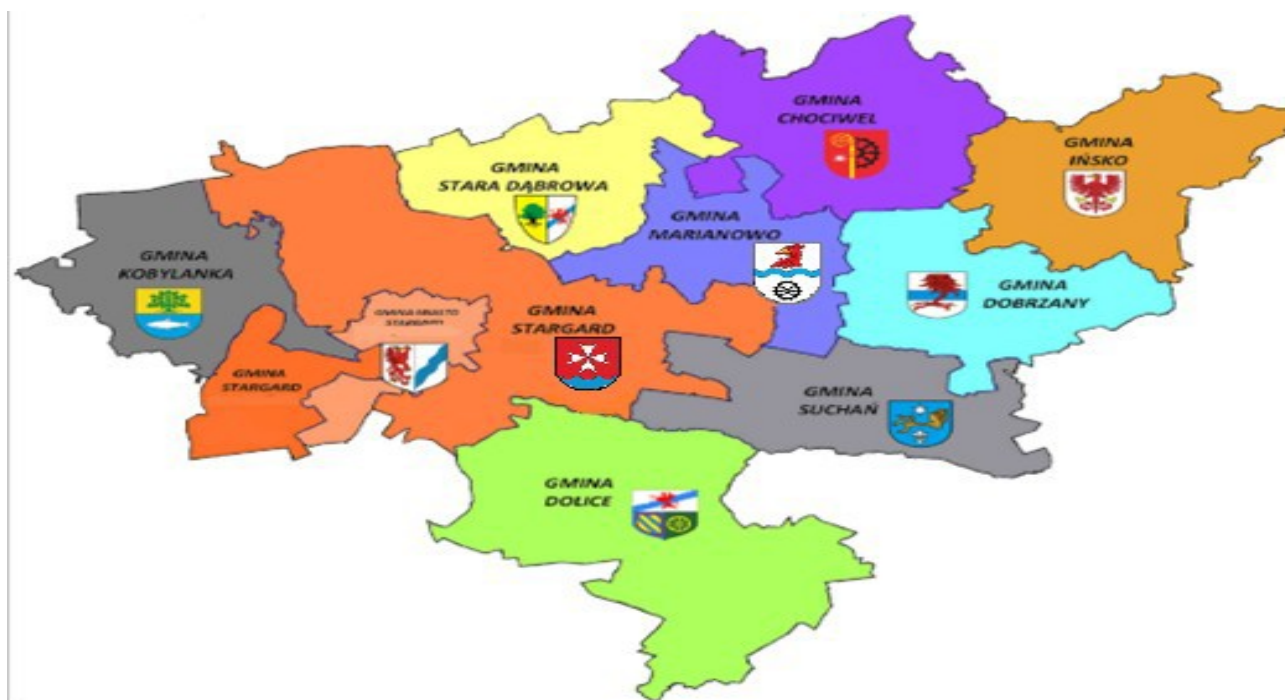
Rysunek 1: Mapa Powiatu Stargardzkiego