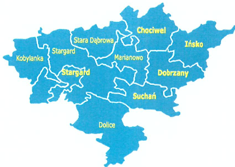
rys. Powiat Stargardzki

Dokument ten jest wynikiem doświadczeń z dotychczasowej wieloletniej współpracy z organizacjami pozarządowymi z lat poprzednich. Powstał on w oparciu o wiedzę, praktykę, doświadczenie i zaangażowanie jego realizatorów.